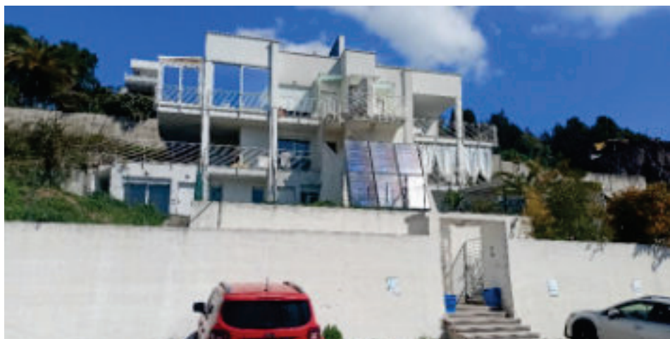
1 - Fronte principale edificio da Via dei Ligustri