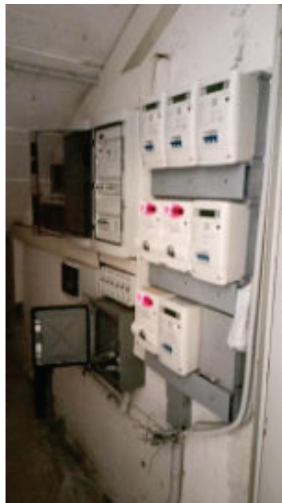
14.Quadro Contatori Energia Elettrica nel locale contatori