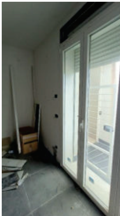
6- Finestra Salotto

Procedimento di esecuzione immobiliare n.58/2017 R.G.Es. – LOTTO 3 BANCA POPOLARE DI SPOLETO S.p.A., ora CERVED CREDIT MANAGEMENT S.P.A. (MANDATARIA DI 2WORLDS S.R.L.) contro GEDA COSTRUZIONI S.R.L.