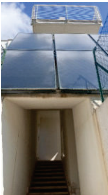
2- Vano scale Comune (Sub. 2-B.C.N.C.)